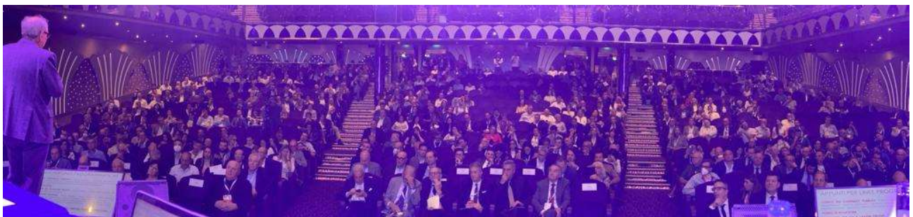
Figura 2 – Audizione finale del presidente uscente del CNI, Armando Zambrano, ai 1300 ingegneri presenti in sala