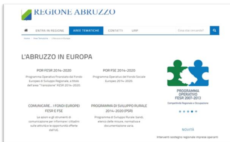
La sezione 'Abruzzo in Europa' del sito internet della Regione Abruzzo è l'elemento cardine della strategia di comunicazione del POR FESR

Al sito si affiancano i profili Facebook "Regione Abruzzo" e "Abruzzo Regione aperta" per i servizi al cittadino, anche se tutta la strategia dei social, per il 2021, ricondotta alla sola comunicazione europea, con ciò rispondendo anche ad un indirizzo del Valutatore.