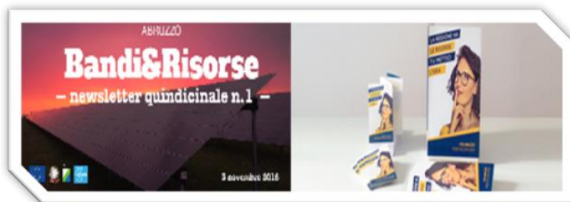
La newsletter Bandi & Risorse e i materiali a stampa sono alcuni degli strumenti utilizzati per la promozione e l'informazione delle opportunità offerte dall'Unione Europea tramite il Programma POR FESR.

La comunicazione off line prevede interventi di informazione e pubblicità rivolti al grande pubblico affiancati e rafforzati dalla comunicazione on line. In questo tipo di comunicazione si collocano la newsletter Bandi&Risorse , i passaggi tabellari sui principali quotidiani abruzzesi, i comunicati stampa diffusi periodicamente, i materiali informativi a stampa .